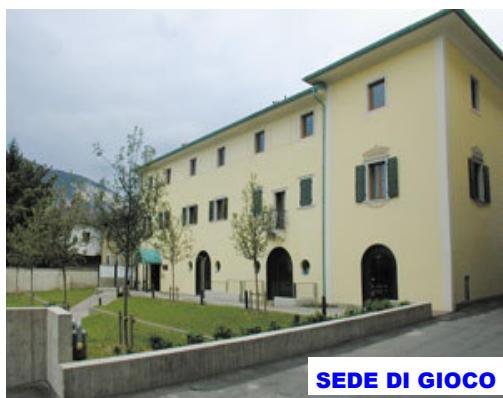
SEDE DI GIOCO

DATA domenica 2 dicembre 2007 SEDE GIOCO Circolazione Gardolo (Piazzale Lionello Groff, 2)